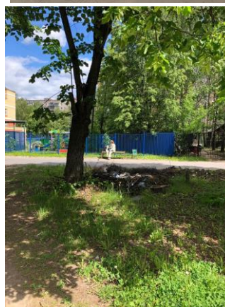
Территория около Кафе «Панорама», ул. Циолковского, д.6а и ДОУ №43 пр-д Циолковского, 6б