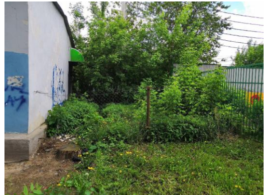
Территория около магазина «Винный клуб», ул. Исаева, 1г и ДОУ №43 ул. Марины Цветаевой, 10