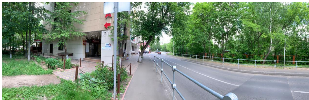
Территория около Кафе «Визави», Полевой пр-д, 4а и Ресторана «Версаль», Полевой пр-д, 8а, ДОУ №34 ул. Космонавтов 6б