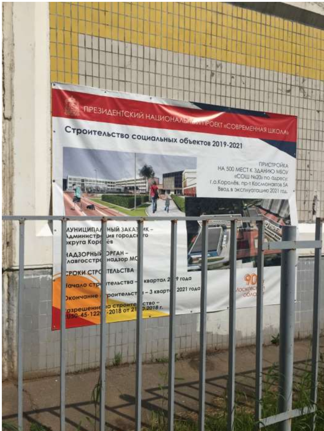
Информационный стенд строящегося объекта (пристройка к зданию МБОУ СОШ № 20 г.о. Королёв, проспект Космонавтов, д. 5а)