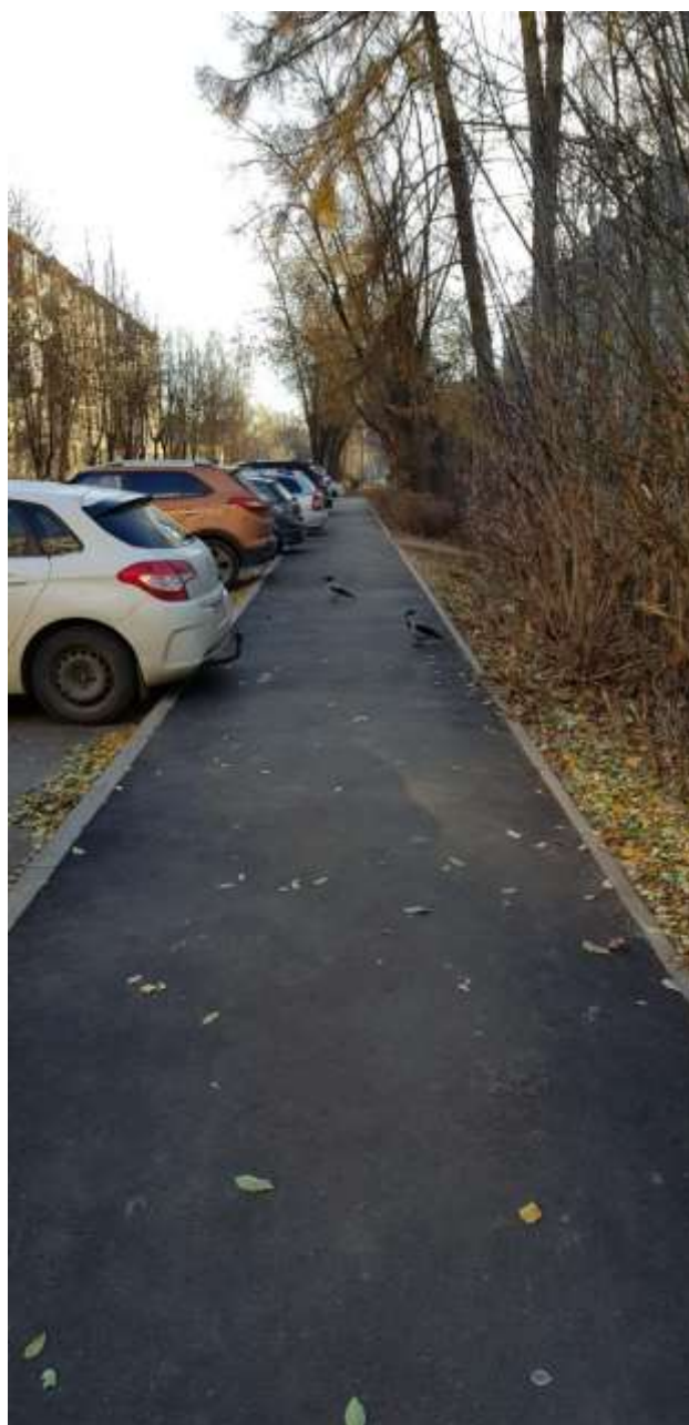
Завершаются работы по созданию дополнительного парковочного кармана